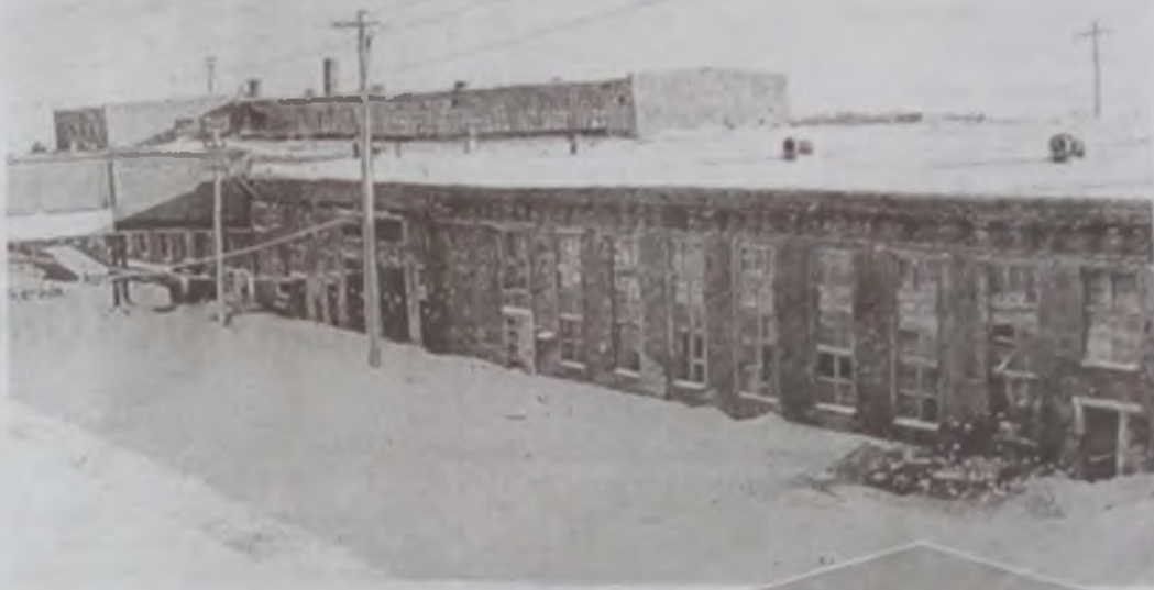
По заключению строительной экспертизы, почти 30-35% производственных помещений идут под снос, в том числе и здание на снимке.

Теперь это все предстоит реанимировать. Кстати, в данный